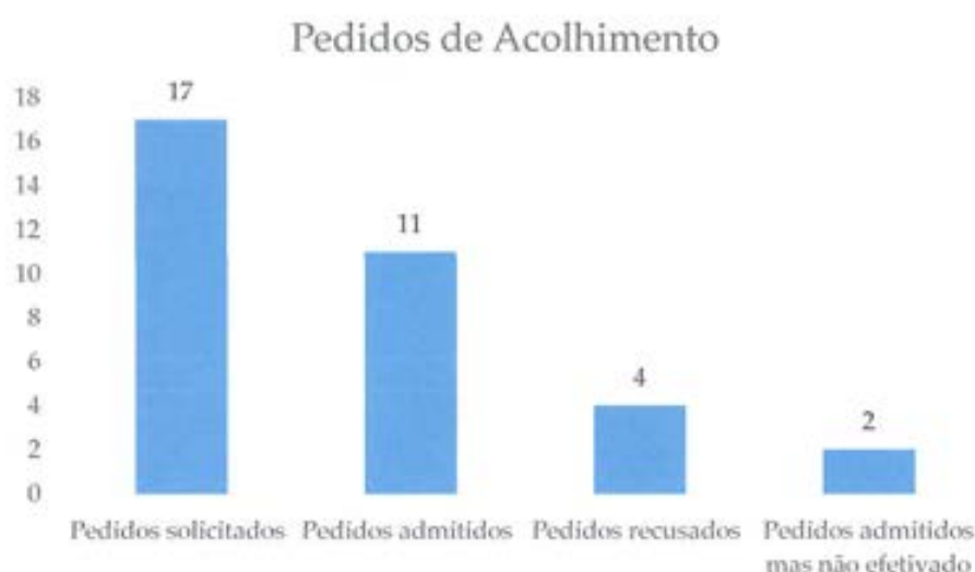
Gráfico n.º 1: Pedidos de Acolhimento através da Gestão de Vagas da Segurança Social

A Casa de Acolhimento da Associação Bispo D. António Barroso tem capacidade para acolher trinta (30) crianças e jovens em situação de risco. No que se refere a análise da capacidade, tivemos durante o ano, dezassete (17) pedidos por parte da gestão de vagas da Segurança Social, como se pode verificar no gráfico n.º1, contatando-se ainda no mesmo gráfico que foram admitidas treze (13) jovens, contudo houve duas (2) situações que não foram integradas por terem sido anulados os pedidos por parte da gestão de vagas da Segurança Social. Assim, foram integradas, efetivamente, onze (11) crianças e jovens, apesar de termos dado vaga para treze (13). Efetuando uma análise comparativa com o ano de 2016 podemos verificar que houve um decréscimo nos pedidos de acolhimento por parte da gestão de vagas da Segurança Social, no ano de 2016 foram solicitadas vinte e cinco (25) vagas e no ano de 2017 foram dezassete (17). A Casa de Acolhimento (C.A) efetuou onze (11) integrações no ano de 2017, registando-se doze (12) saídas, no que diz respeito, à concretização de projetos de vida. Tendo em conta o elevado volume de circulação de crianças e jovens – total de 23 saídas e entradas – verificam-se alguns constrangimentos na ausência de uma estabilidade contínua no tempo, influenciando na consolidação do trabalho desenvolvido.