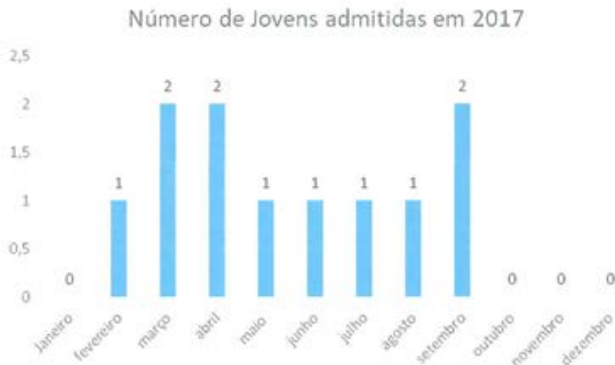
Gráfico n.º2: número de acolhimentos iniciados no ano de 2017

Constata-se ainda, no gráfico n.º2, que nos meses de janeiro, outubro, novembro e dezembro não houve acolhimentos, coincidindo com o ano anterior (2016) nos meses de outubro, novembro e dezembro.