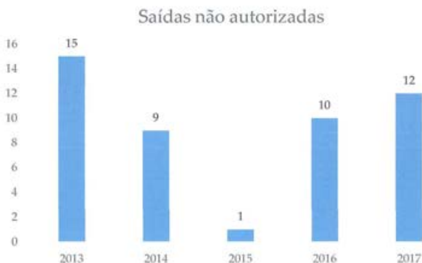
Gráfico n.º 4: Saídas não autorizadas nos últimos anos – 2013 a 2017

Nos últimos anos tem-se analisado as saídas não autorizadas por ter havido situações complexas no ano de 2013 que trouxeram algumas preocupações acerca deste fenómeno. Assim, analisaremos o gráfico n.º4. Pode-se constatar que no ano de 2017 ocorreram doze (12) saídas não autorizadas, denotando-se um pequeno acréscimo em relação ao ano de 2016. Analisadas estas saídas foi possível verificar que foram praticadas por jovens com alterações de comportamento e episódios de crise. Foi um ano (2017) em que a Casa de Acolhimento manteve aos seus cuidados jovens com critérios para lar especializado, verificando-se uma maior necessidade de adaptação e inovação de estratégias de intervenção. Continua-se a constatar um elevado número de perturbações emocionais, comportamentais e intelectuais, constituindo-se variáveis complexas de controlar. Assim, os dados referidos no gráfico n.º 4 deverão ser analisado tendo em conta estes fatores.